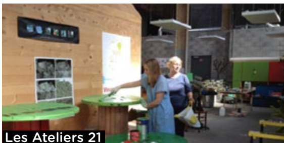
Les Ateliers 21