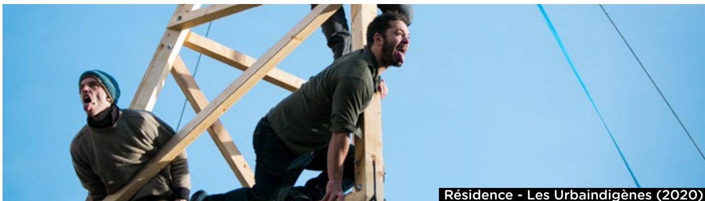
Résidence - Les Urbaindigènes (2020)

avec des résidences d'artistes et des sorties de fabrique toute l'année