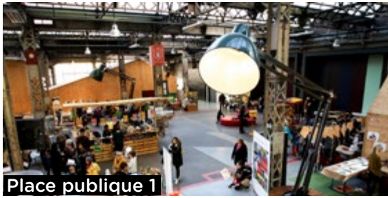
Place publique 1