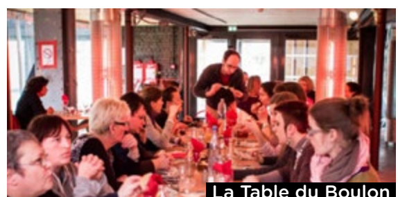
La Table du Boulon