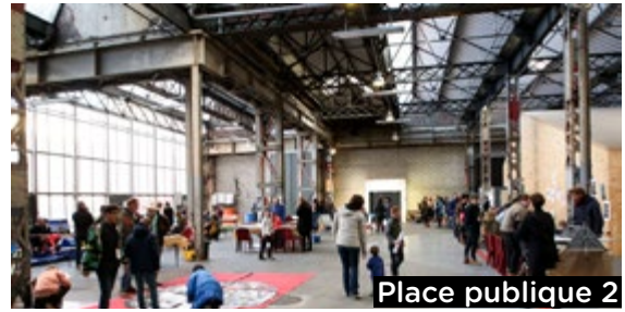
Place publique 2