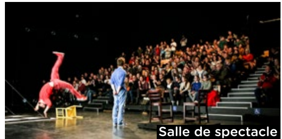
Salle de spectacle