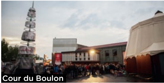
Cour du Boulon