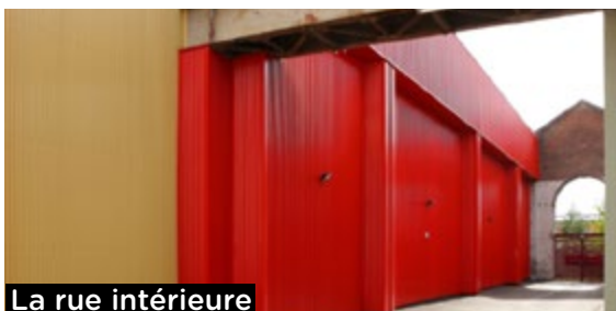
La rue intérieure